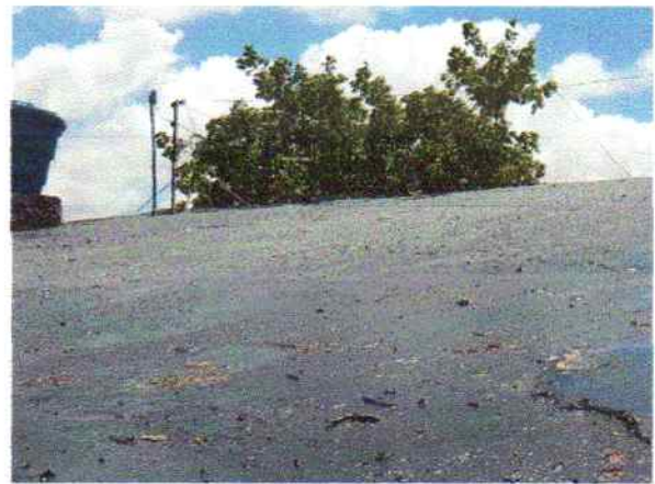
Foto 10 - Visão externa do PSF Serra do Umari impermeabilização da laje