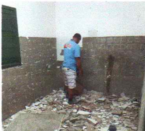
Foto 5 - Visão interna do PSF Serra do Umari Demolição do revestimento cerâmico