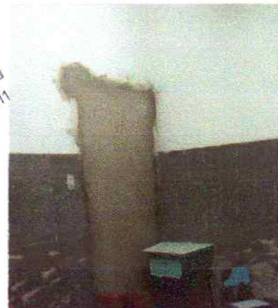
Foto 12 - Visão interna do PSF Serra do Umari alvenaria de 1/2 vez e revestimento