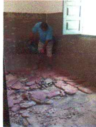
Foto 8 - Visão interna do PSF Serra do Umari demolição de revestimento de piso