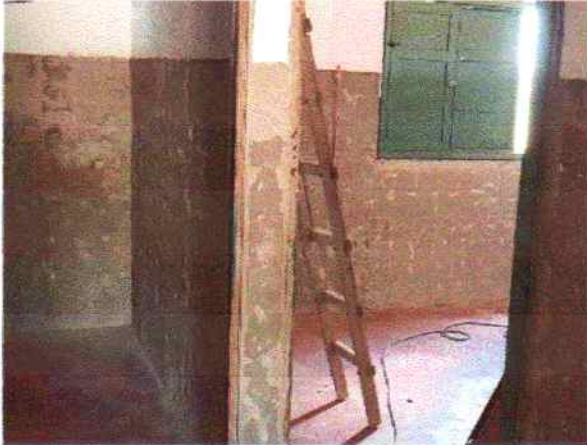
Foto 7 - Visão interna do PSF Serra do Umari demolição de revestimento cerâmico e retirada de esquadrias