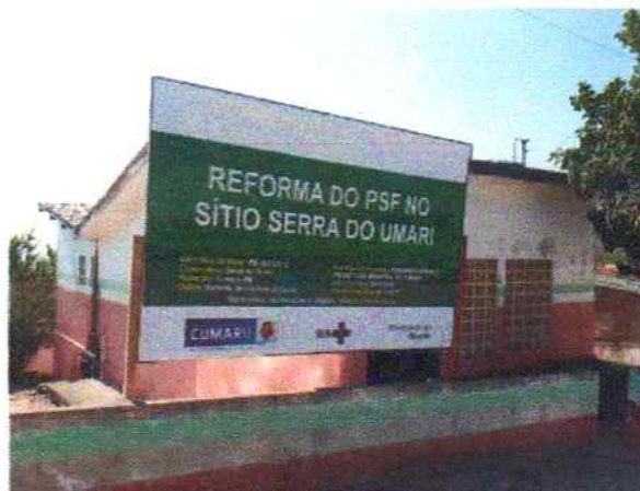
Foto 4 - Visão externa do PSF Serra do Umari Placa de obra