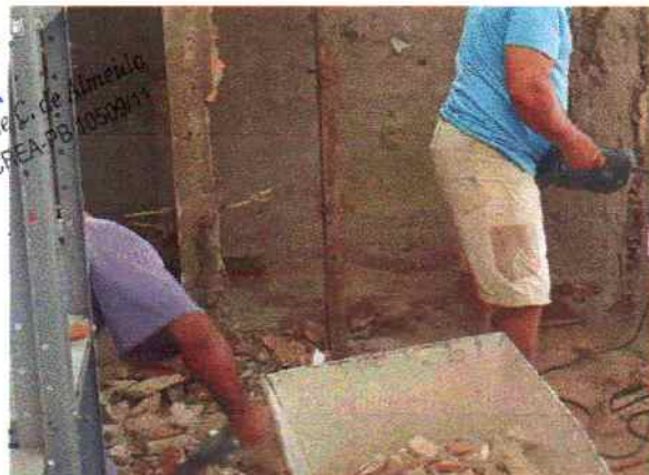
Foto 6 - Visão interna do PSF Serra do Umari Demolição de alvenaria de 1/2 vez

Henrique E. de Almeida Eng. Civil - CREA PB 050911