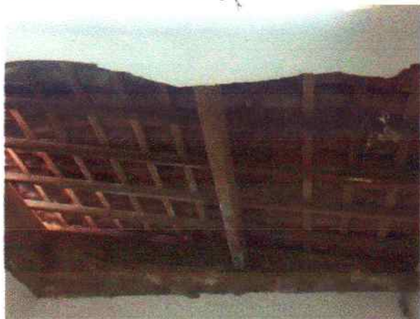
Foto 3 - Visão interna do PSF Serra do Umari antes do início dos serviços