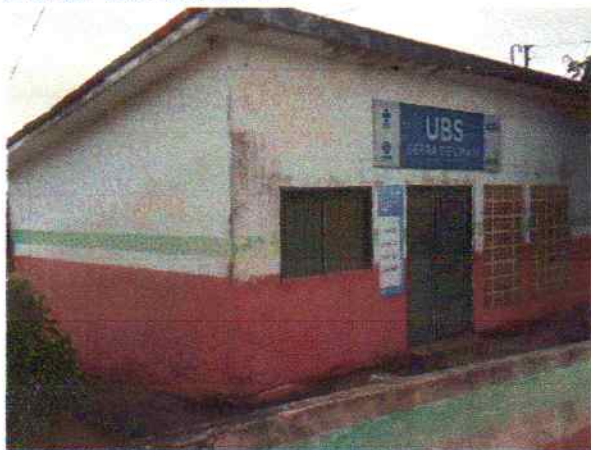
Foto 1 - Visão externa do PSF Serra do Umari antes do início dos serviços