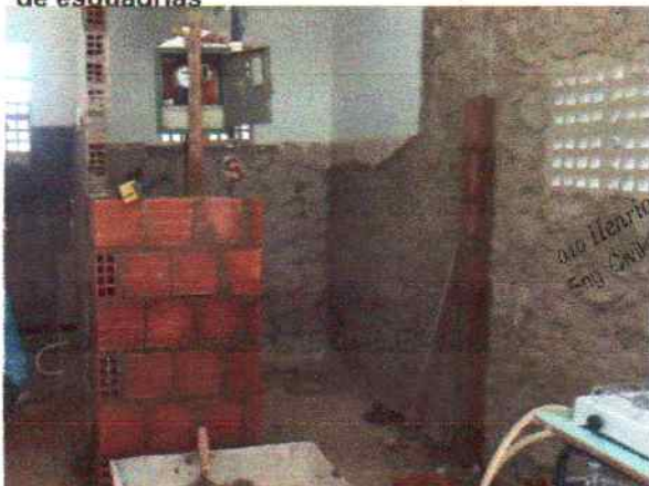
Foto 11 - Visão interna do PSF Serra do Umari Alvenaria de 1/2 vez