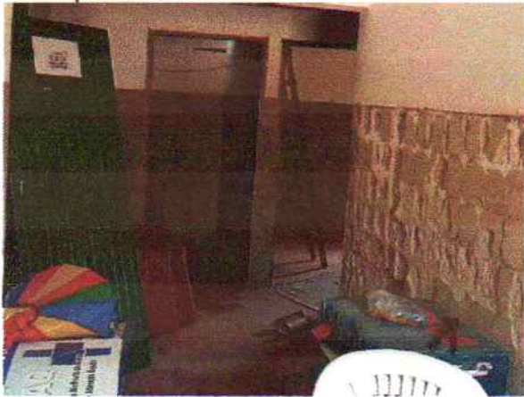
Foto 9 - Visão interna do PSF Serra do Umari demolição do revestimento cerâmico e retirada de esquadrias