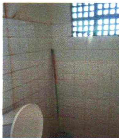
Foto 2 - Visão interna do PSF Serra do Umari antes do início dos serviços